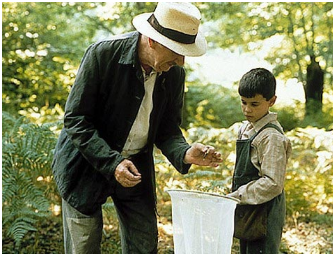
«¿Qué hay, Gorrión? Espero que este año podamos ver por fin la lengua de las mariposas».

Creo que nunca corrí tanto como aquel verano anterior al ingreso en la escuela. Corría como un loco y a veces sobrepasaba el límite de la Alameda y seguía lejos, con la mirada puesta en la cima