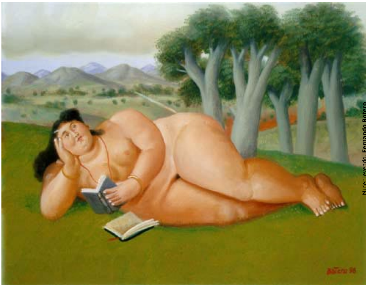
Mujer leyendo, Fernando Botero

El libro se abre ante nosotros como se abre de piernas la amante entregada y posesiva. Como abren los brazos para acogernos el amigo y el familiar. En mi prehistoria se abrieron para mí los brazos diminutos, débiles y sucios de los primeros cuentos de calleja. Ya entre ellos se observaban diferencias sociales. Los más baratos cabían en la palma de la mano, su letra era casi ilegible y tenían las mejillas manchadas de tizones como de carbón o de tinta de escribir palotes, curvas y garrotes. No parecían pensados para que los leyeran los niños, sino las abuelitas, desojándose, al borde de la cuna. En cambio, los más caros, en octavo, se leían con facilidad y tenían letras de oro en la portada.