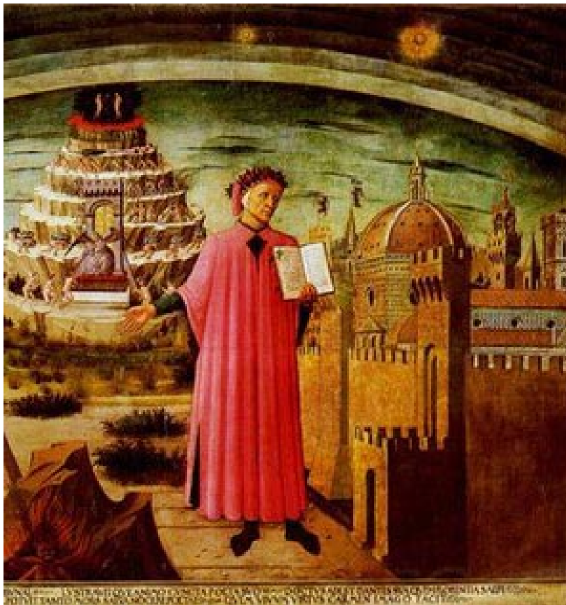
Dante imaginó el mundo de la inmortalidad en los tres escenarios de la tradición católica: purgatorio, infierno y cielo.