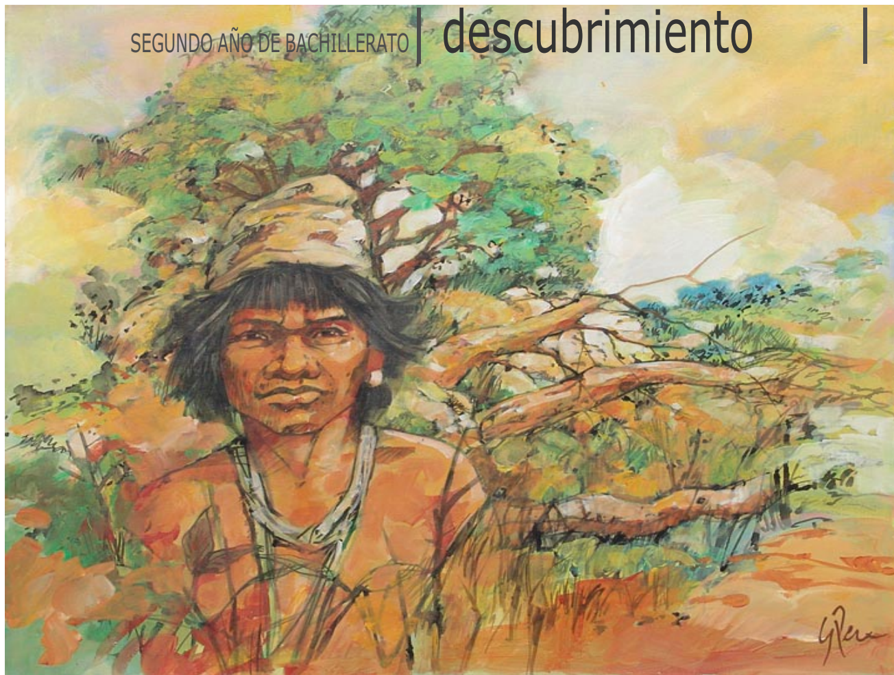
ILUSTRACIÓN: GUILERMO PEÑA.