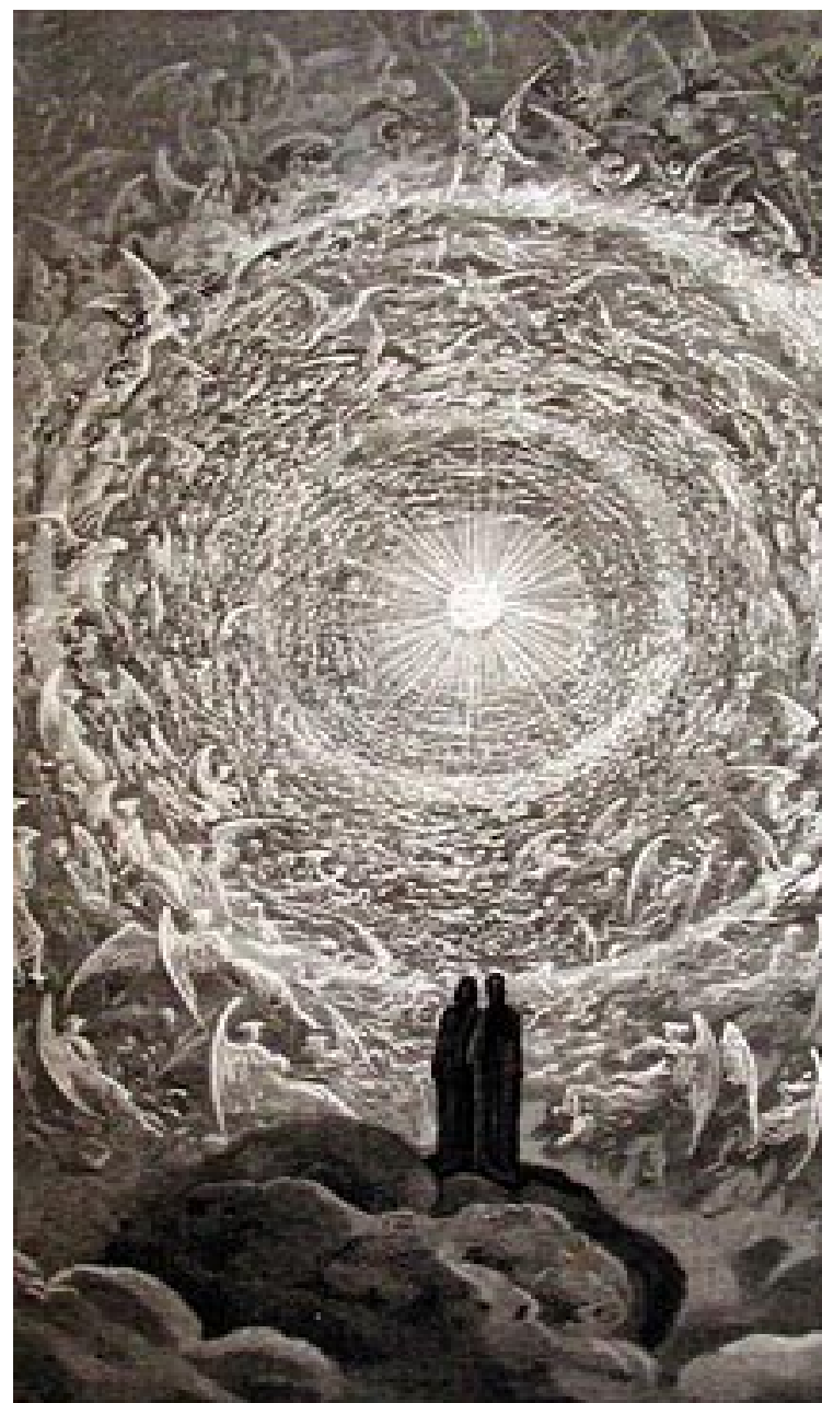
Virgilio es quien guía a lo largo de los caminos del hades al buen Dante.

*Otras obras de Dante Alighieri: Rimas, Epístolas (escritas en latín), De la vulgar elocuencia (en latín), El Convite o Convivio (en latín y toscano), La monarquía (en latín), Églogas (en latín), Cuestión del agua y de la tierra (en latín).