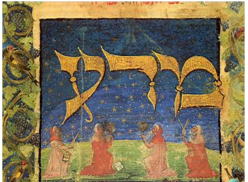
La presencia judía en España fue determinante para su desarrollo arquitectónico y médico. En las cortes siempre había un médico judío.

En el siglo IX, la llegada al poder de la dinastía Carolingia supuso el inicio de una nueva unidad europea basada en el legado romano, puesto que el poder político del emperador Carlomagno dependió de reformas administrativas en las que utilizó materiales, métodos y objetivos del extinto mundo romano.