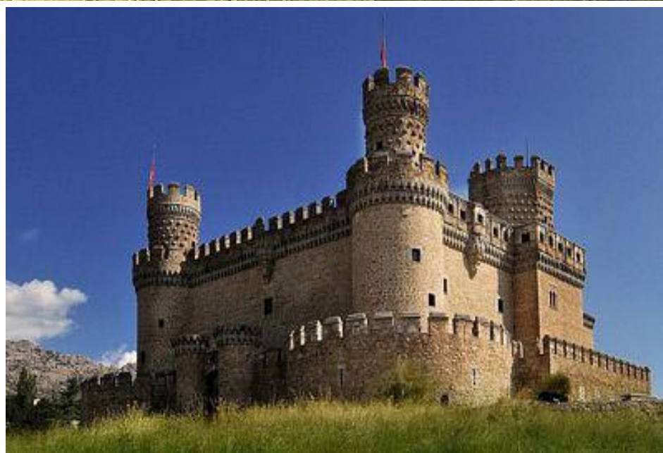
Los castillos españoles son la evidencia de aquellos años en que un hombre dominó muchas tierras.