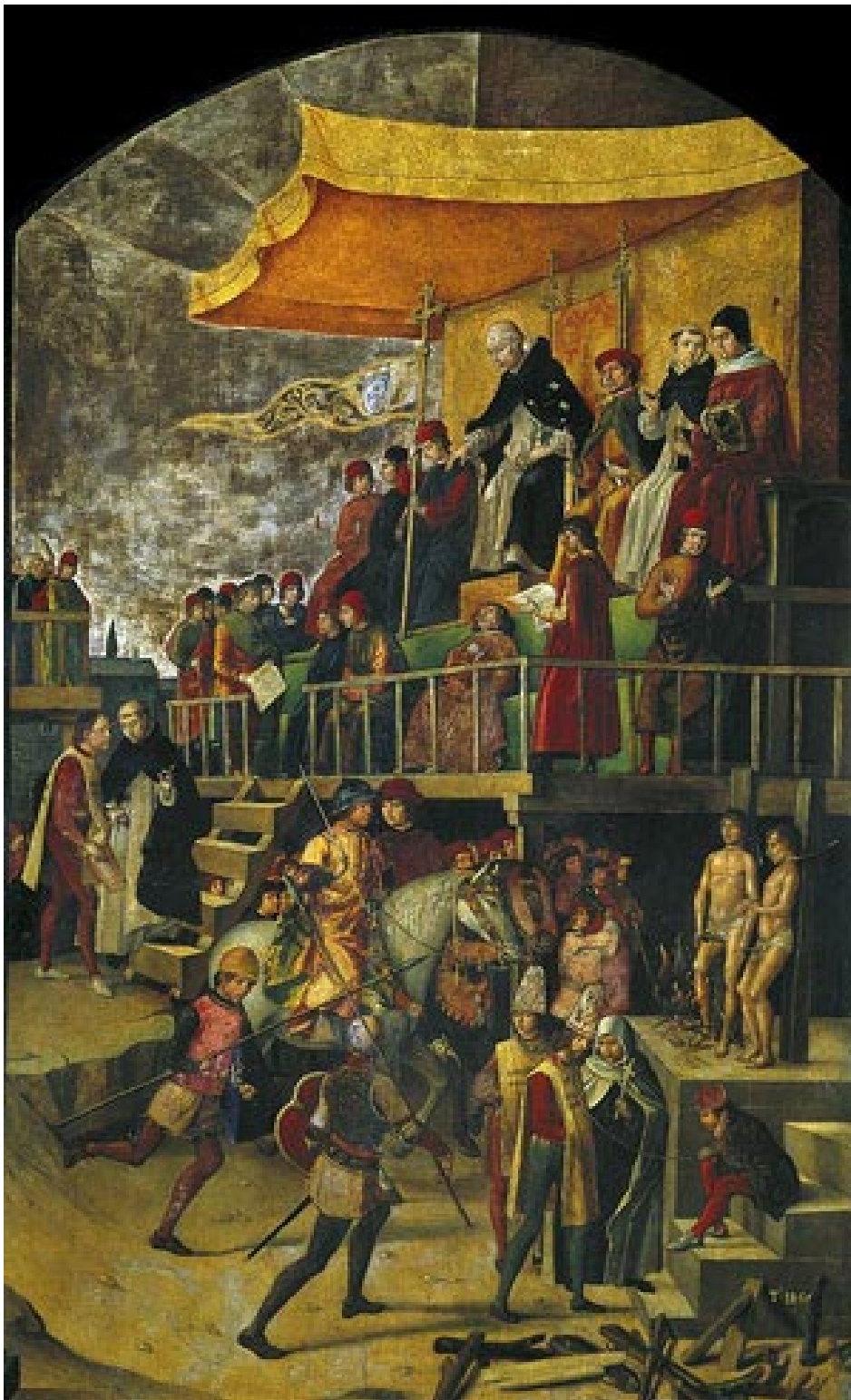
La fe que predominó en esos años de Edad Media fue la católica, aunque en España también el judaísmo y el islamismo tuvieron auge.