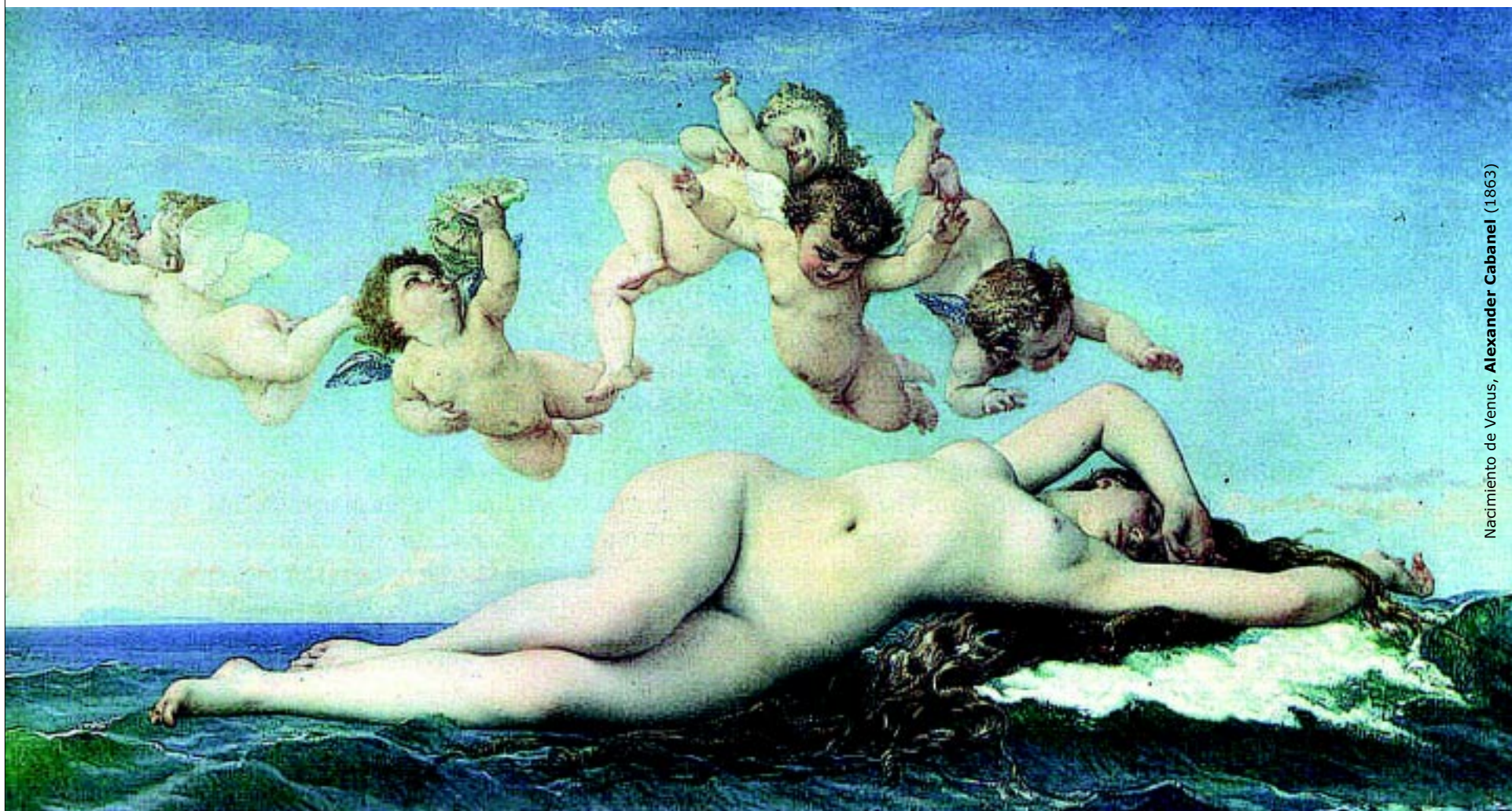
Nacimiento de Venus, Alexander Cabanel (1863)