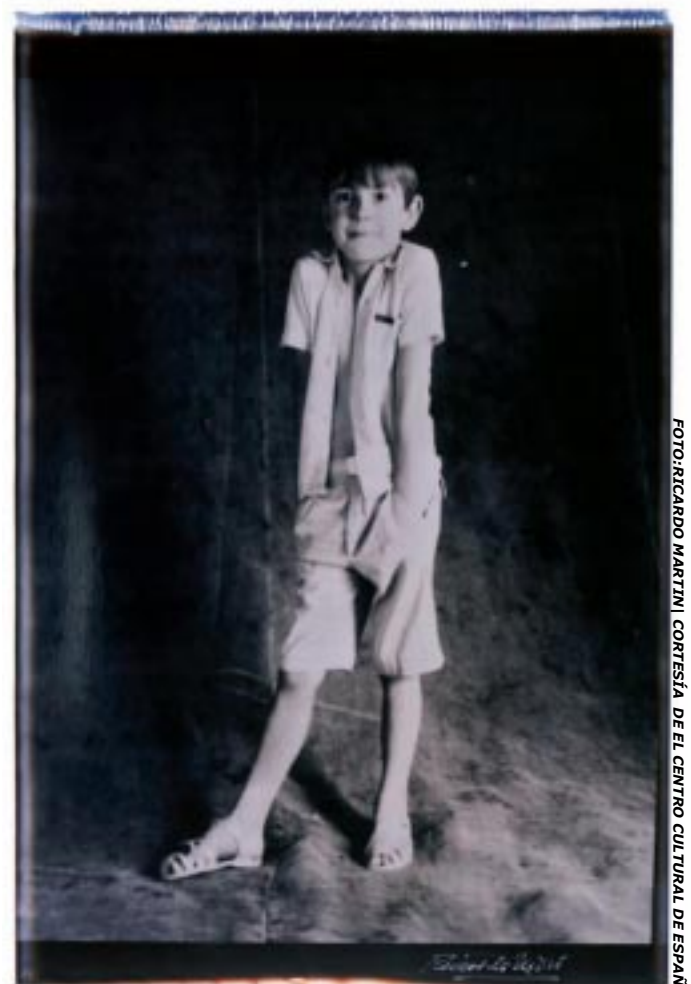
FOTOGRAFADO MARTINI | CORTESÍA DE EL CENTRO CULTURAL DE ESPAÑA