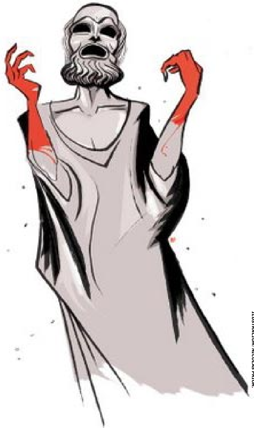
ILUSTRACIÓN: NICOLÁS PRIOR.

Los atenienses, como otros griegos, creían fielmente en todo lo que se exponía en estas obras de tragedia, comedia y épica