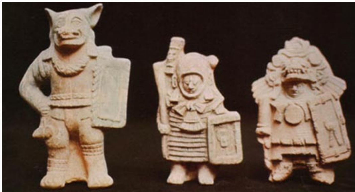
El mundo maya dejó un importante legado a Mesoamérica.