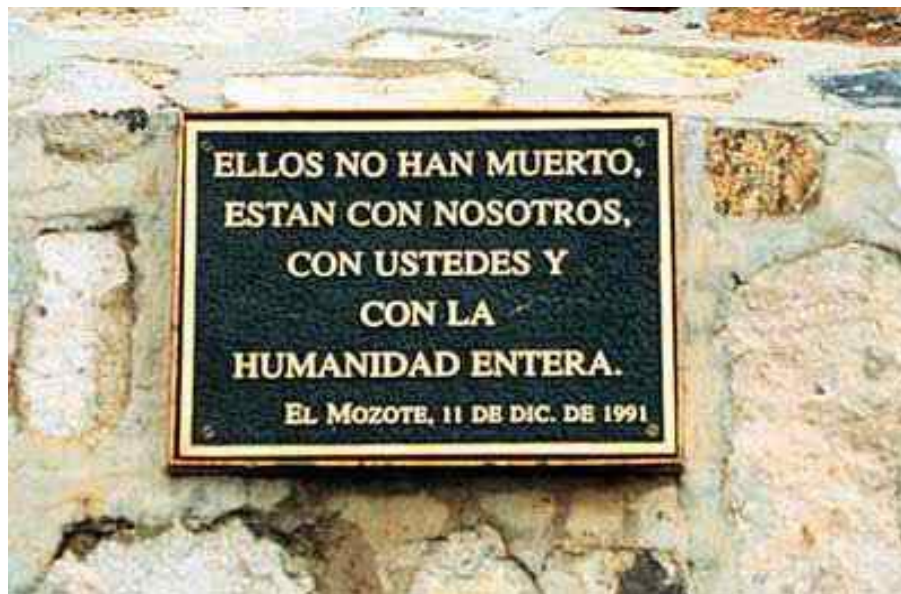
Placa conmemorativa erigida en el lugar del holocausto para recordar la memoria de las víctimas de El Mozote.

noche de un 9 de diciembre a una aldea llamada El Mozote. Cumplieron su misión un día 11: dar muerte a más de 730 personas, de entro ellos, cerca de 500 niños y niñas. Estos últimos fueron puestos boca abajo contra el suelo, en filas, para ser acribillados. Las mujeres fueron de igual manera apartadas. Sus restos quedaron triturados y calcinados tras el incendio premeditado del lugar donde fueron asesinadas. Los hombres fueron acribillados en cualquier parte. Como holocausto que fue, muchas víctimas recibieron su muerte orando o en alabanzas religiosas. Otra vez las preguntas de Job, se oyeron en la desgracia.