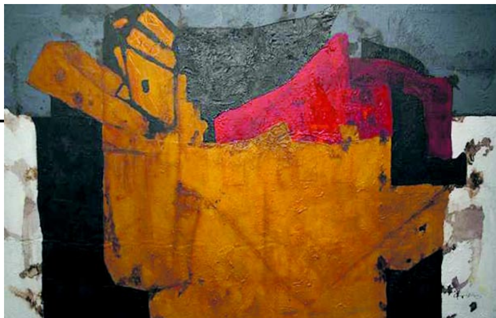
PINTURA: RODOLFO OVIEDO.

Catálogo del Festival de la diversidad cultural, UNESCO, París 2010