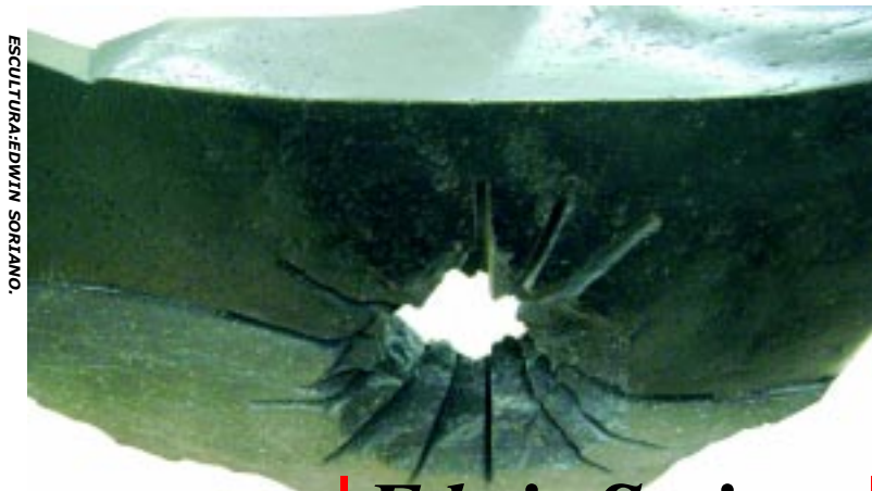
ESCULTURA: EDWIN SORIANO.