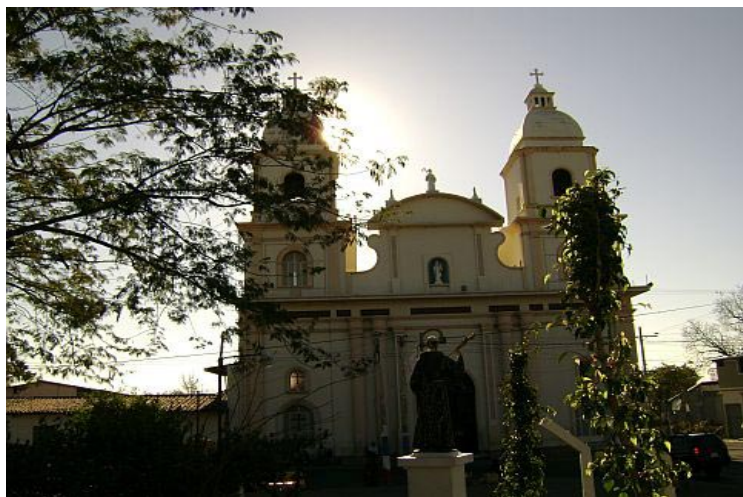
EL SOL. se dejó entrever en las colinas y una brisa sigilosa terminaba de abrigar las esperanzas de que se convirtiera en un día inolvidable para algunos.

representante de la Guardia Nacional. Es la esquina obligada, por donde las reinas de los diferentes barrios saludan a la población, las sonrisas del jardín, reflejo de la primavera en flor son esparcidas como huellas que