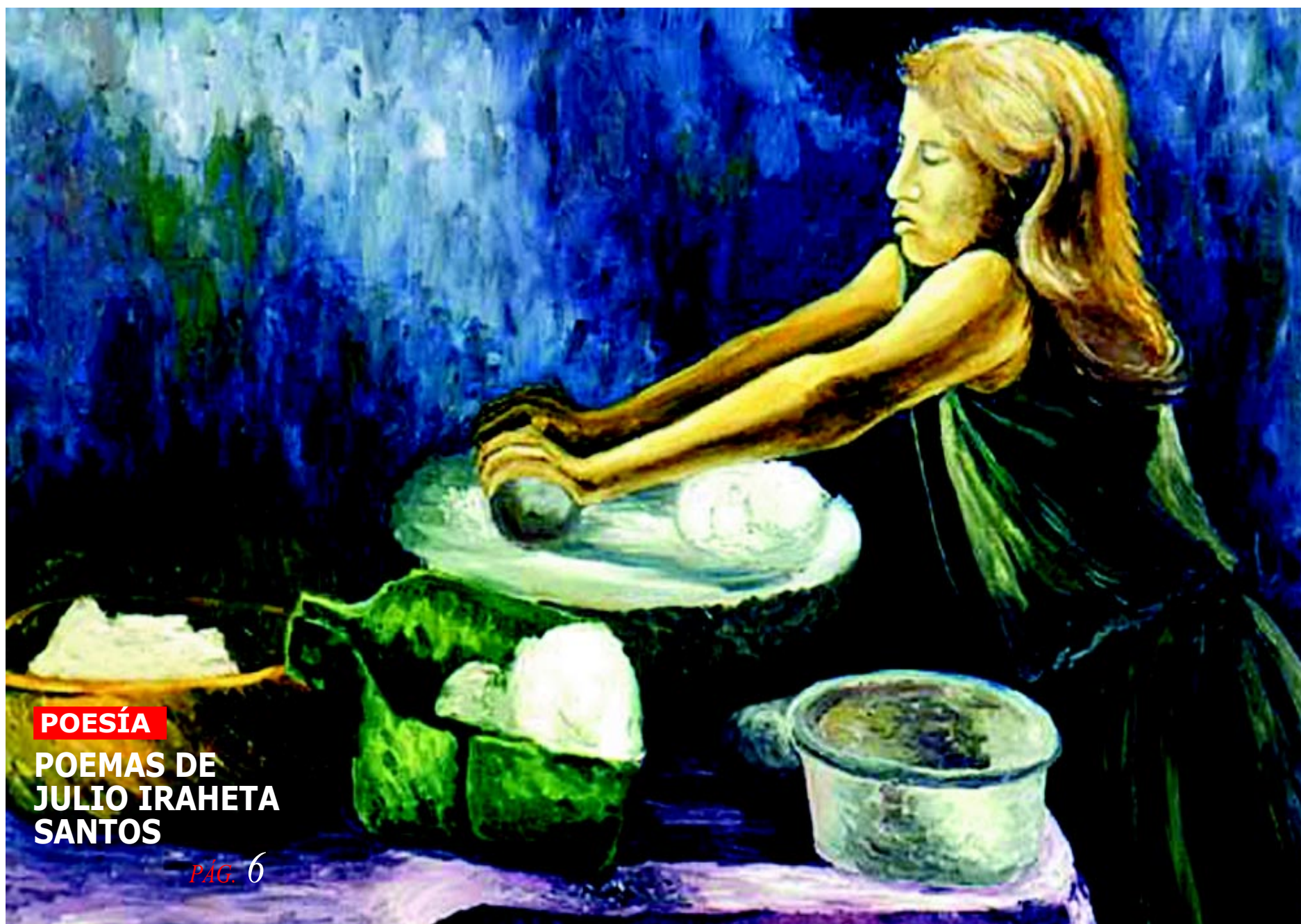
PINTURA: ADOLFO PAYÉS