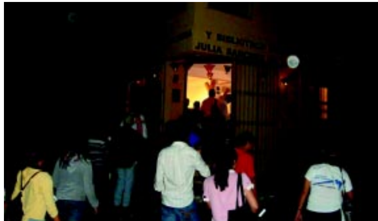
Visitamos La Casona, un lugar que existe desde hace 110 años.

El ballet Folclórico Nacional aportó la magia de la noche, «nuestras tradiciones son las que no hacen diferentes de todos los países del mundo» en boca de sus miembros, se hizo sentir y de inmediato se inició la presentación del Ballet con la canción de «Los cumpas», seguido de una canción de cuna «dormite ya» del maestro chalateco Saúl López; el baile de Los Panaderos, el Torito pinto; Adentro Cojutepeque, Los Lustradores, para terminar con el baile de «las Leyendas» donde la Siguanaba, con el mito de la infidelidad castigada, se hizo acompañar del Cadejo, la carreta chillona, el sacerdote sin cabeza, el Cipitío. Durante esta presentación la figura de la mujer, que solía pedir a los hombres ser llevada en ancas, y a la mitad del camino les mostraba las uñas sobre las espaldas y luego las carcajadas a los lejos quedó evidenciada en la interpretación de la danza, como un testimonio del