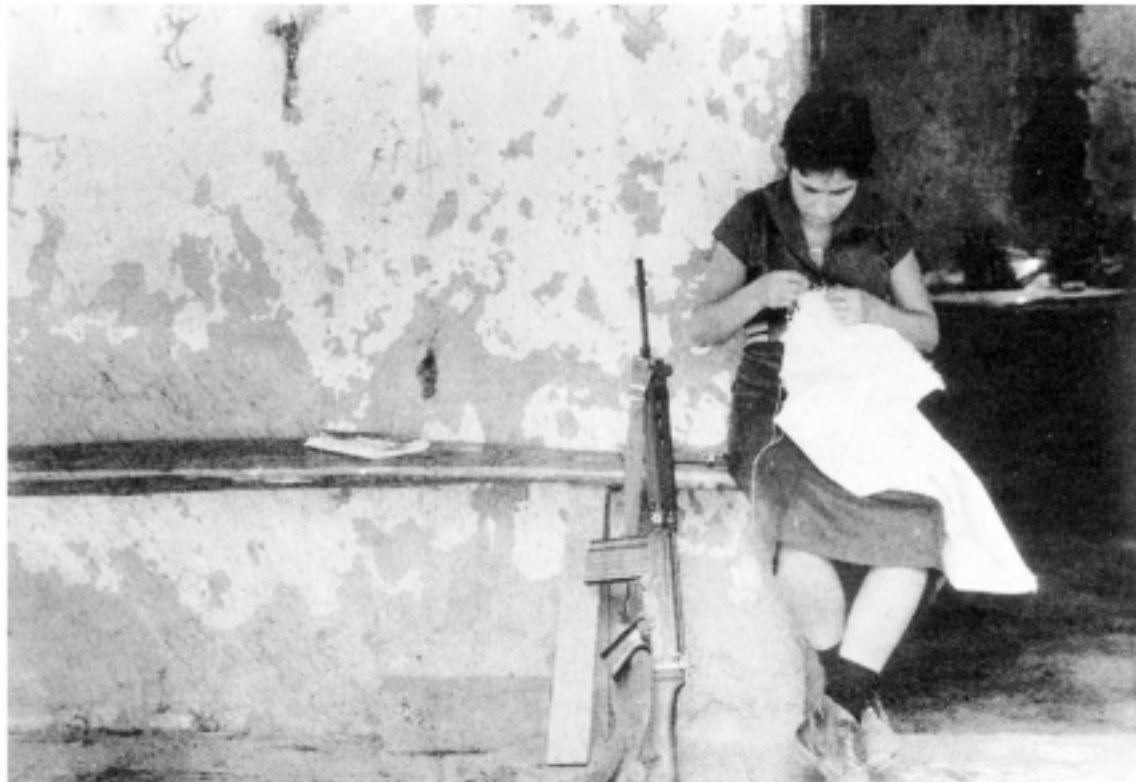
Muchos combatientes compartieron su vida con la lucha armada.