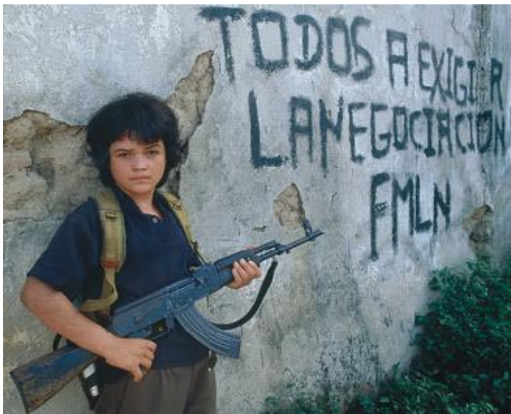
Los retos de los jóvenes literatos fueron mayores al final de la guerra.

Algunos jóvenes escritores fallecieron en esos años