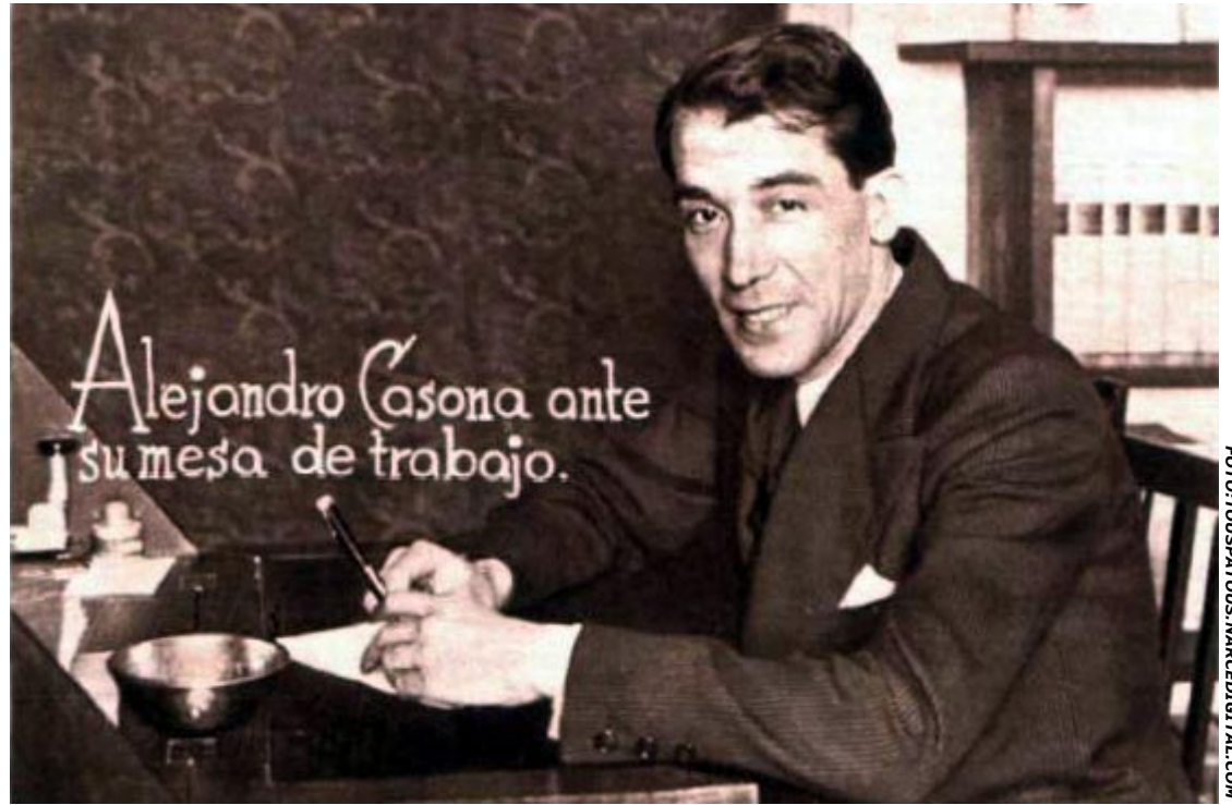
«Los hombres libres no toman nada ni por la fuerza ni por limosna».

Como vemos, Casona debe agradecer al continente americano tanto la oportunidad de entregarse como el gozo de recoger una cosecha de éxitos continua que, poco a poco, se irá extendiendo por toda Europa y el mundo, siendo representado en Milán, París, Río de Janeiro, Lisboa, Burdeos, Munich, Florencia, Dublín, Amsterdam, Bruselas, Johannesburgo,