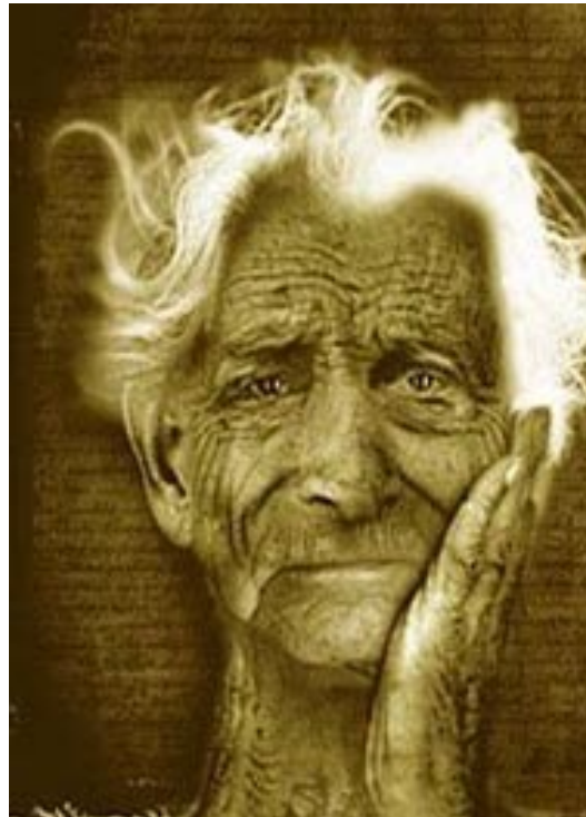
Durmió. Una noche de 1994.

En una oportunidad había comido hongos, de esos que crecen debajo de la caca de las vacas y se había tomado una sopa de floripundias, por un momento se creía un