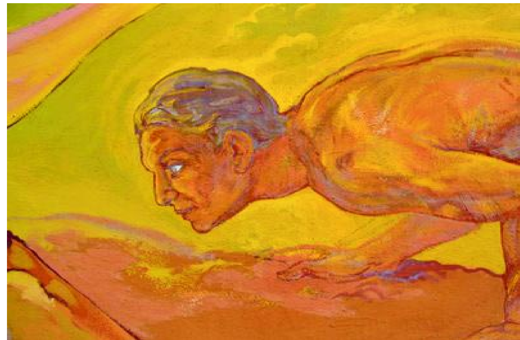
DETALLE HOMBRE TIERRA DE EDGAR TREJO