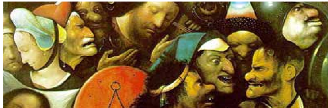
DETALLE CRUCIFICCIÓN DE CRISTO POR EL BOSCO

Sin embargo, en la esencia del sentido del humor, el artista revela su soledad, su gran soledad. Ahora bien, si la soledad es el «fondo último de la condición humana», es porque en ella el hombre, si es capaz, encuentra su verdadera personalidad. Sabemos que existe la soledad creadora y la que destruye, él, no se