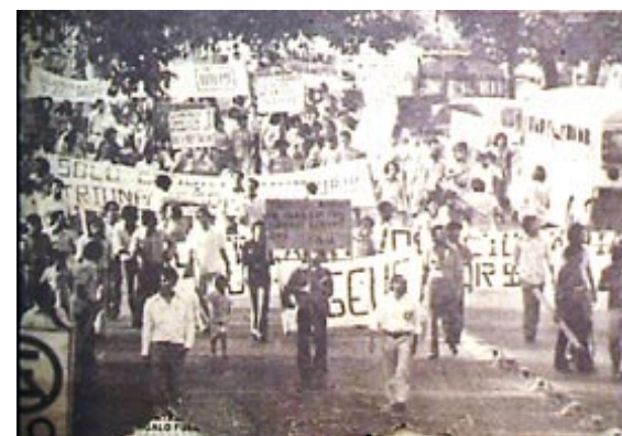
DEFENSORIA DE LA UES

Reconozco y entiendo, que lo que me hace falta alrededor e internamente sos vos. Sentir cerca tu silueta de mujer exquisitamente