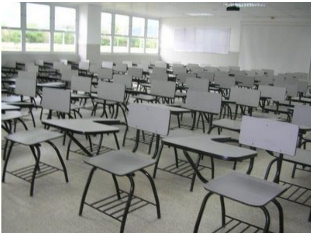
Los textos argumentativos se caracterizan por la organización de acontecimientos en forma temporal

La estructura de problema solución es característica de los textos en los que se aportan soluciones a hechos o situaciones adversos.