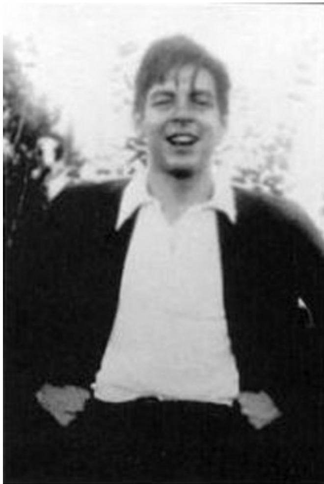
El Ché en su juventud

No es que yo quiera darte pluma por pistola pero el poeta eres tú.