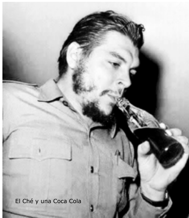
El Ché y una Coca Cola

Anécdota cuento leyenda o rumor de mi memoria llega ahora este ocho de octubre del ochenta mientras mi hijo camina junto a mí al regreso de la escuela y me ofrece este pedazo de pan en sus manos que comienzan a deshojar libros y romper cristales y sacar punta a sus sueños y a sus lápices y ya recogerán su lluvia retomarán su sol pedirán la palabra en las asambleas desgajarán a su tiempo sus mujeres sus panes venideros como éste que me ofrece ahora trece años después de aquella fecha de la que no comienzo a hablarle porque me distraigo porque me concentro largamente en la textura del pedazo de pan que me ha dado y en el calor que se desprende de su masa haciendo que esta tarde empiece a oler de pronto a madrugada y calle abajo andando y silbido de pecho que ama y sufre tanto y rumor de la memoria anécdota cuento leyenda que miro y viene caminando a mi lado desgajando el pan de su época