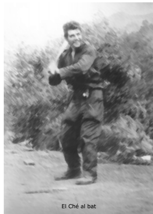
El Ché al bat

La gente suele decir, los americanos, los norte-americanos suelen decir: León Felipe es un “Don Quijote” No tanto, gentlemen, no tanto. Sostengo al héroe nada más ... y sí, puedo decir ... y me gusta decir: que yo soy Rocinante. No soy el héroe, pero le llevo sobre el magro espinazo de mis huesos y le oigo respirar ... y he aprendido a respirar como él... y a injuriar y a blasfemar y a maldecir y a relinchar. A mí me gusta mucho relinchar. “¡Oh, hideputas! ... estos malos encantadores que me persiguen” ¿Cómo es aquel relincho, americanos? Aquel que empieza: ¡Justí-í-í-cia!! Aquí el acento cae sobre la í, muy agudo y sostenido como un vibrante y estridente cornetín: ¡Jus-tí-í-í-cia!! ¡Qué bonito relincho! A Rocinante le gusta mucho relinchar. Y a mí también me gusta mucho relinchar. Tenéis que aprender, americanos. Venid. Vamos a relinchar ahora, ahora mismo todos juntos, desde el capitolio de Washington... fuerte, fuerte, fuerte... hasta que el relincho llegue a Viet Nam y lo oigan todos los vietnamitas, y a Cuba también y lo oigan todos los cubanos, como el cornetín de la gran victoria universal, hasta que lo oigan los hombres todos de la tierra como el cese definitivo de todas las hostilidades del planeta. ¡Justí-í-í-cia! ¡Oh, qué hermoso relincho! The most beautiful neigh of the world.