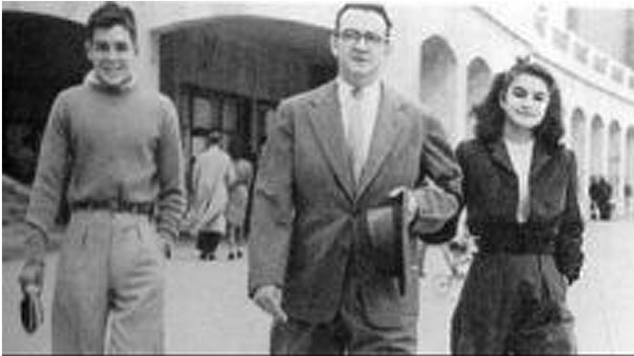
El Ché junto a su padre y su hermana, en Buenos Aires.