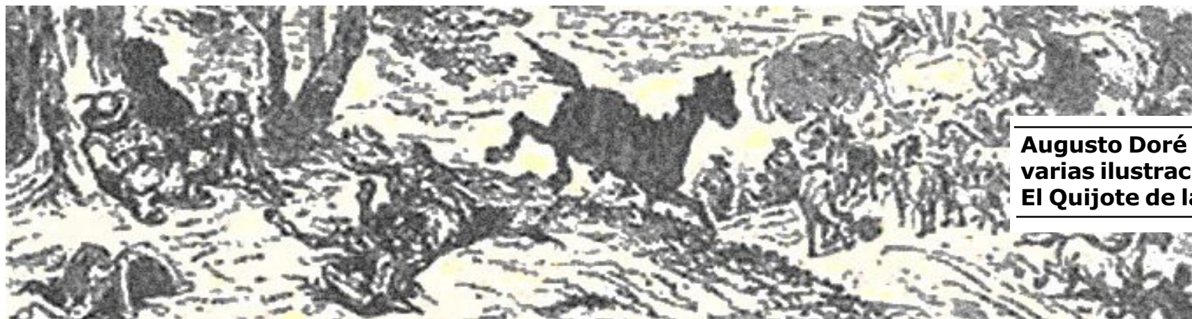
Augusto Doré realizó varias ilustraciones para El Quijote de la Mancha

tan estraña mudanza. Ya en este tiempo era muerto el padre de nuestro Grisóstomo, y él quedó heredado en mucha cantidad de hacienda, así en muebles como en raíces, y en no pequeña cantidad de ganado, mayor y menor, y en gran cantidad de dineros; de todo lo cual quedó el mozo señor desoluto, y en verdad que todo lo merecía, que era muy buen compañero y caritativo y amigo de los buenos, y tenía una cara como una bendición. Después se vino a entender que el haberse mudado de traje no había sido por otra cosa que por andarse por estos despoblados en pos de aquella pastora Marcela que nuestro zagal nombró denantes, de la cual se había enamorado el pobre difunto de Grisóstomo.» Y quiérosos decir agora, porque es bien que lo sepáis, quién es esta rapaza; quizá, y aun sin quizá, no habréis oído semejante cosa en todos los días de vuestra vida, aunque viváis más años que sarna. -Decid Sarra -replicó don Quijote, no pudiendo sufrir el trocar de los vocablos del cabrero. -Harto vive la sarna -respondió