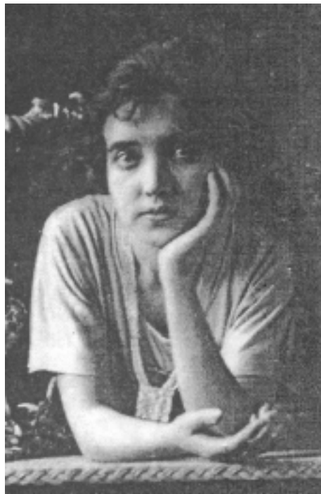
Claudia en su adolescencia (1913)