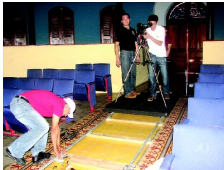
Durante la filmación del documental «El Nacional», en el interior del Teatro Gavidia.

Actualmente el teatro se encuentra en funcionamiento y es administrado por la Secretaría de Cultura. Con frecuencia alberga diferentes actividades artísticas y culturales, entre ellas presentaciones de piezas teatrales y exposiciones fotográficas y de pinturas.