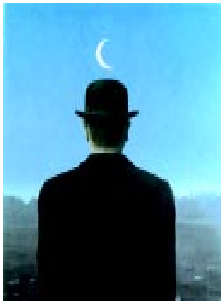
Magritte. El maestro de escuela

su piso algunas noches a la semana, pues todos le han visto llegar en más de una ocasión con su mochila de cuadernos escolares y vestido con su uniforme. Nadie le ha denunciado jamás. Simplemente los muchachos le dejan vivir. Él, a ellos, imposible.