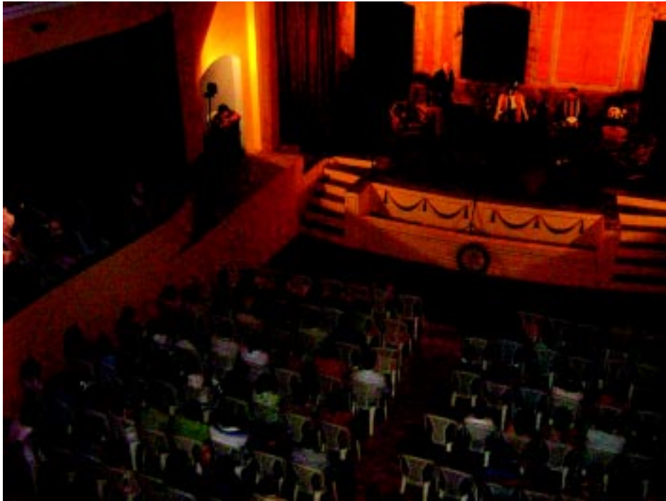
Una presentación teatral en esta joya arquitectónica del oriente del país.

«El teatro no se hace para cantar las cosas, sino para cambiarlas», expresaba Vittorio Gassman, considerado entre los mejores actores y directores italianos de teatro y cine. Verbigracia de sus palabras, el Teatro Nacional «Francisco Gavidia» cambió la vida de los migueleños desde que abrió sus puertas para que las maravillas del arte pudieran ser contempladas desde otra perspectiva.