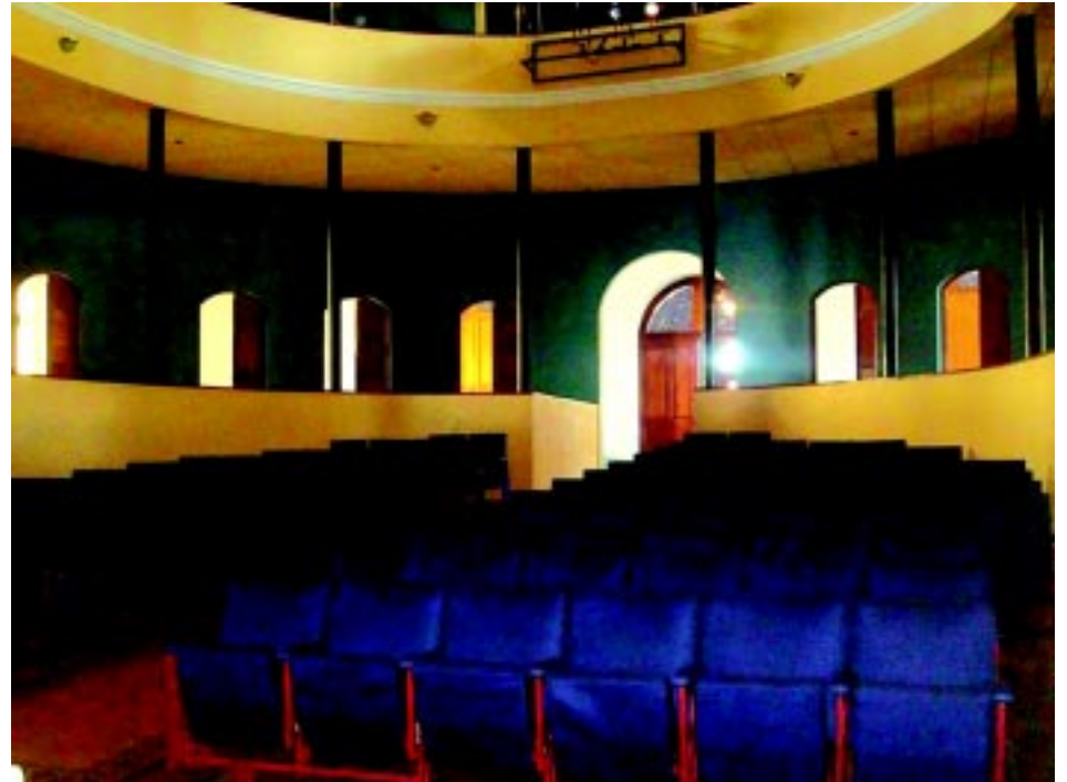
Interior del Teatro Francisco Gavidia, que estará cumpliendo 100 años el próximo 31 de diciembre