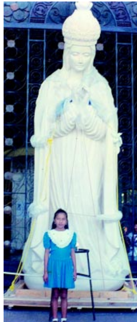
Escultura monumental de la Virgen de los Pobres, develada y bendecida el 27 de diciembre de 1997 en la catedral de Zacatecoluca.