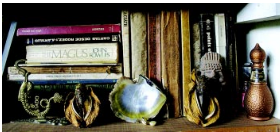
La librería de Kijadurías.

Así fue. Le digo a Parada que ahora mire