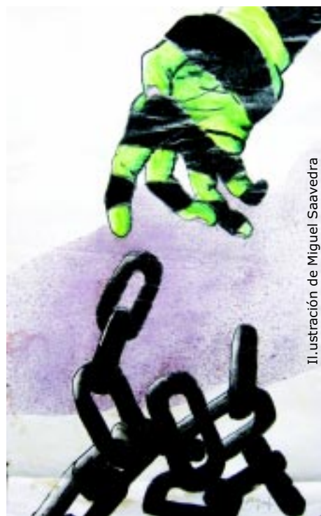
Ilustración de Miguel Saavedra

Quienes cultivan la cultura y el arte, no