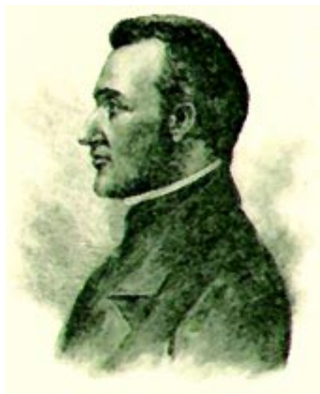
«Excito a la juventud que es llamada a dar vida a este país que dejo con sentimiento, por quedar anarquizado y deseo que imiten mi ejemplo de morir con firmeza, antes que desgraciadamente»: Morazán

Estas contradicciones, no dejaron que Francisco Morazán, guardara su espada y defendiera la legalidad a través de su gestión progresista, pero al final el caudillo desistió de su empeño y se autoexilió de Centroamérica. Así el 5 de abril de 1840, salió de El Salvador embarcándose en el Puerto de La Libertad, junto a treinta y cinco correligionarios, viajando con él liberales de mucho prestigio, que posteriormente reprodujeron su ideario, entre ellos: El Dr. Isidro Menéndez; el General Trinidad Cabañas, Coro-