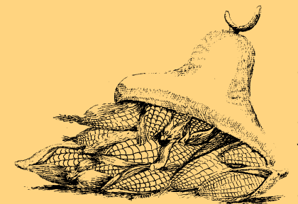
Ilustración de Camilo Fonseca

Olvida mujer el ojo del carcelero. La puerta tiene cerradura y hay viento del otro lado.