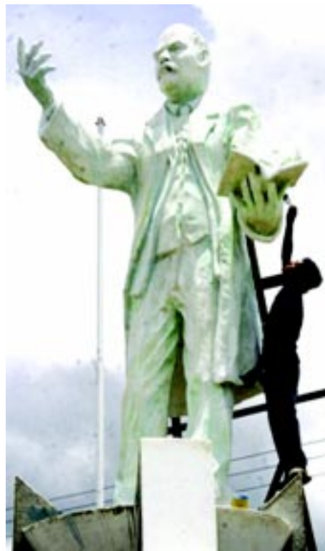
Un trabajador da los toques finales al monumento a José Santos Zelaya en la ciudad de Managua.