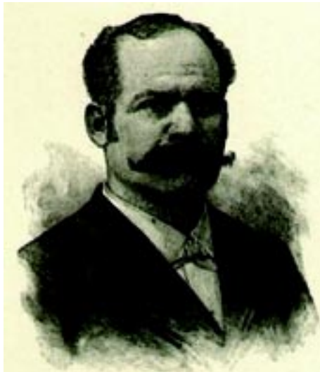
La historia latinoamericana arroja ejemplos aquí y allá: José Santos Chocano junto a Pacheco Villa en la Revolución Mexicana; Gabriela Mistral apoyando la lucha del general Augusto C. Sandino; José Martí cayendo en el Combate de Dos Ríos. Retrato del ex presidente de Nicaragua, José Santos Zelaya.

La historia latinoamericana arroja ejemplos aquí y allá: José Santos Chocano junto a Pacheco Villa en la Revolución Mexicana; Gabriela Mistral apoyando la lucha del general Augusto C. Sandino; José Martí cayendo en el Combate de Dos Ríos. Se suma Darío rechazando el intervencionismo y la opresión. En el poema «Los cisnes» del libro Cantos de vida y esperanza , advierte con interrogantes: «¿Seremos entregados a los bárbaros fieros? / ¿Tantos millones de hombres hablaremos inglés? / ¿Ya no hay nobles hidalgos ni bravos caballeros? / ¿Callaremos ahora para llorar después?».