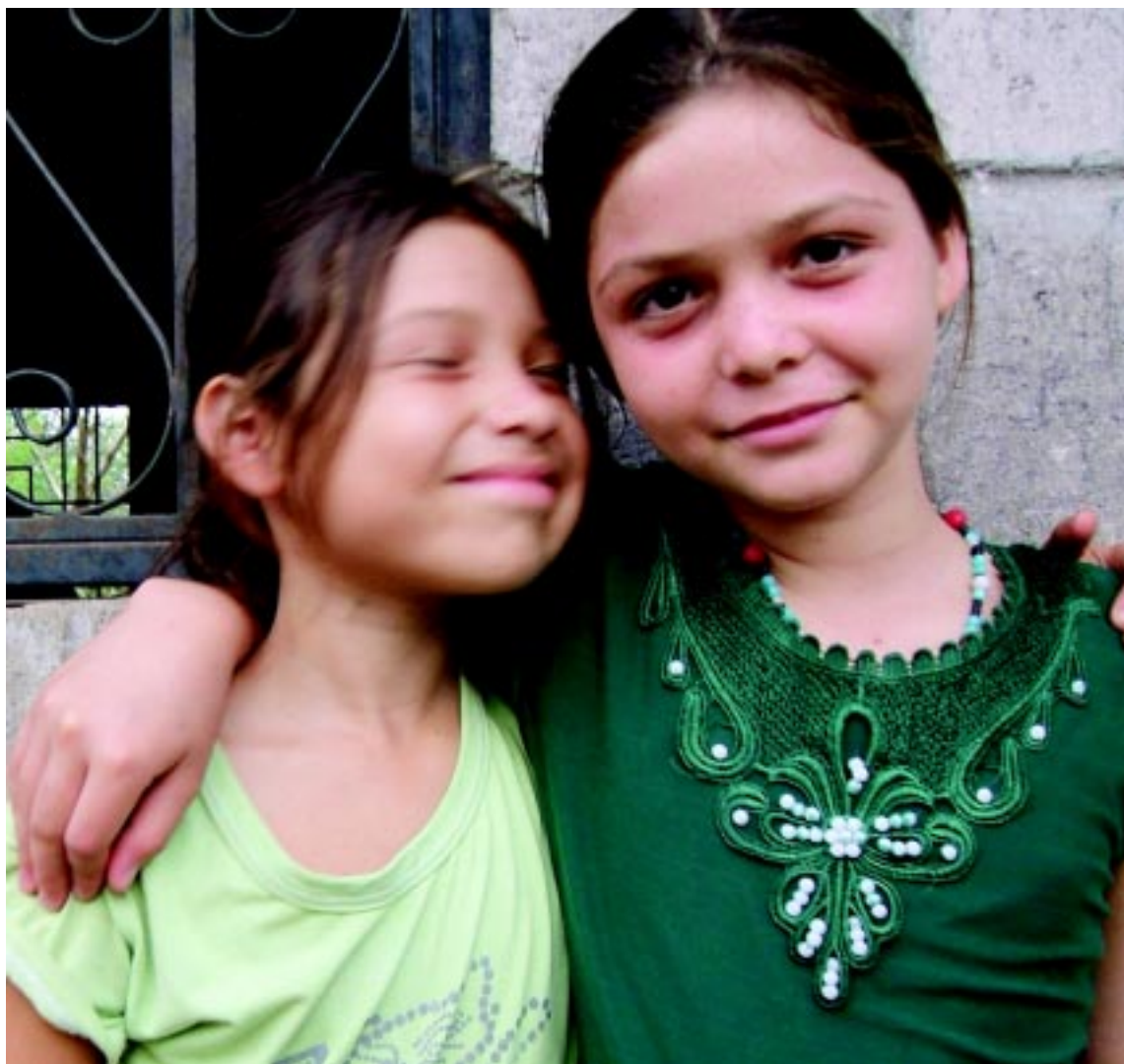
La niñez salvadoreña merece un país de verdad, construido sobre un firme espíritu de solidaridad, dinamizado por el trabajo, aromonizado por la convivencia pacífica y productor de belleza y alegría.