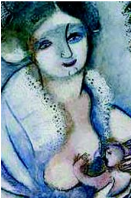
Cd. Tijuana 8 de marzo 2008