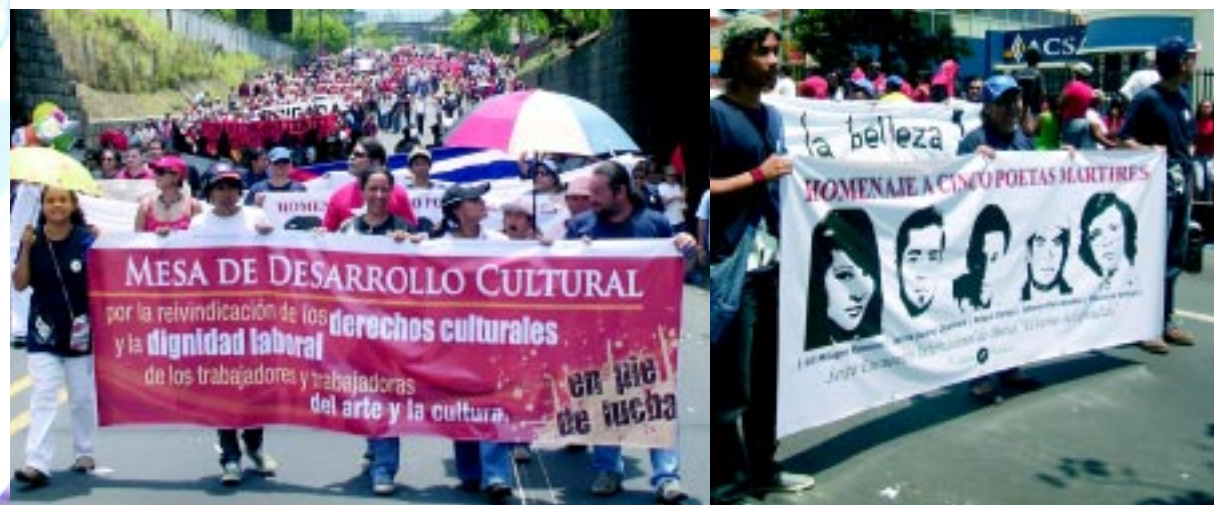
Integrantes de la Mesa de Desarrollo Cultural y de la Fundación Metáfora durante la marcha del Primero de Mayo que convocó a miles de trabajadores salvadoreños.