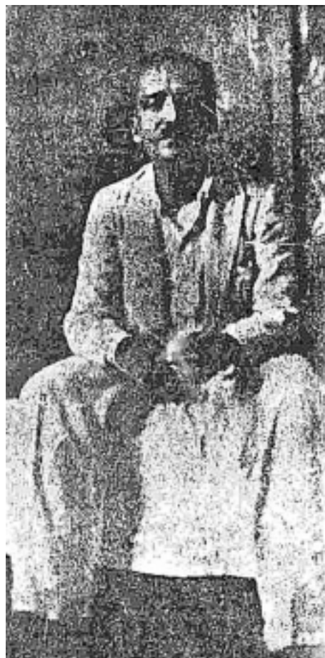
Farabundo Martí, en el claustro donde estuvo preso momentos antes de ser fusilado.