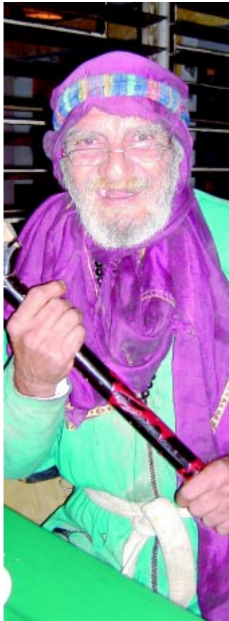
El Mago Barú, en Café la T.

En verdad representaba toda una prueba de amor por un amigo soportar el golpe extremadamente recio, de profundis, que los humores emanados de aquella presencia