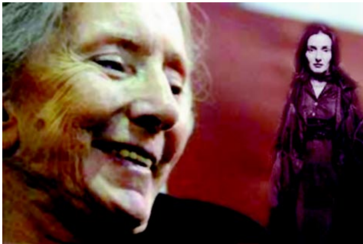
Idea Vilariño en su juventud y en su vejez. 1920-2009