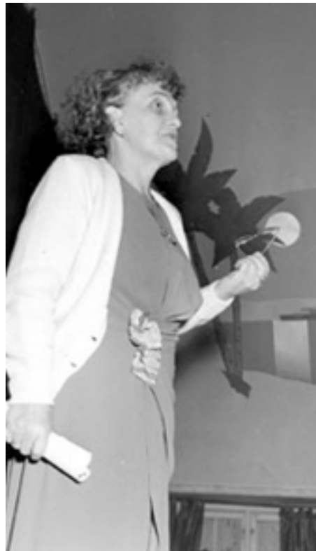
La escritora sueca Moa Martinsson

La noche del día de los muertos de 1890, en el condado de Vårdnäs en Lindköping, el frío castigaba a los jornaleros agrícolas y las ventiscas mordían los cuatro costados de sus casuchas. Tendida en el piso la joven sirvienta Kristina Schwartz pujaba con los dientes apretados. Estaba dando a luz. Su madre hacía las veces de comadrona. Su padre mientras tanto atizaba el fogón y hervía agua. Entre chamizo y chamizo que metía al fuego, rogaba para que a su hija no se la llevaran los dolores del parto. Cuan-