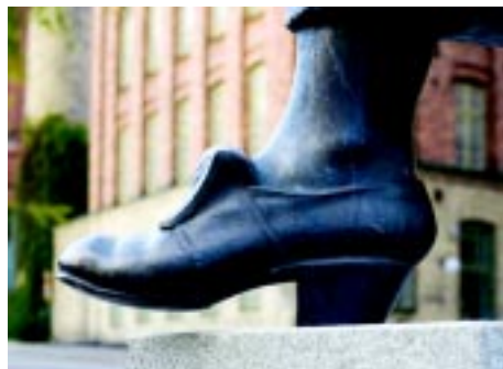
Escultura a Moa Martinsson

Moa Martinsson no es la escritora de las metáforas brillantes ni de las frases célebres