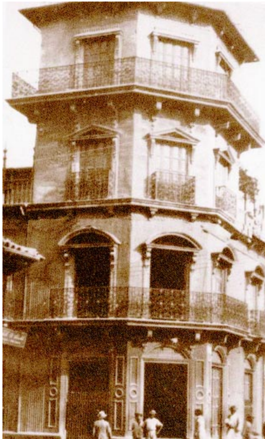
Casa Ambrogi, a media cuadra de la actual Biblioteca Nacional, fue demolida y actualmente hay un punto de microbuses.

Escuchemos al propio Ambrogi, refiriéndose al respecto, en un texto titulado "Modernistas Americanos" que integra su libro "Cuentos y Fantasías": "Los modernistas americanos aman con entusiasmo la novedad. Buscan cómo dar a sus páginas una nota atractiva y cautivante. Ríe en ellas la frase picaruela, bulliciosa; el párrafo se desarrolla como una rica tela bordada". Y continúa: "Hay, en ese breve cenáculo, algunas figuras de importancia que merecen ser bien conocidas. Puede formarse una magnífica galería, en que la pluma luzca sus perfiles de estilo. Corramos la cortina y veamos el fondo del salón. En torno a una mesa