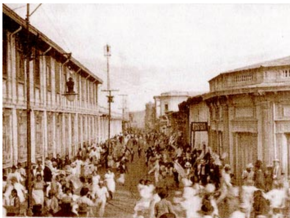
Fotografía histórica que muestra la represión de que fuera objeto una manifestación de mujeres a principio de siglo. La calle es la 6a Calle Poniente, el edificio de la izquierda es actualmente un kinder del Mercado "Sagrado Corazón"

Esta descripción acusa la mordacidad de Ambrogi, su agudeza crítica, que luego se vuelca en próximas páginas, describiendo al "ejército libertador": "El Ejército Libertador avanzaba lento, tardo. Tal una inmensa boa que desenrollaba sus anillos, pesadote, erizado de puntas de bayonetas y de filos de dagas, que relucían al sol. Los soldaditos no marchaban ya: se arrastraban más bien, enloda-