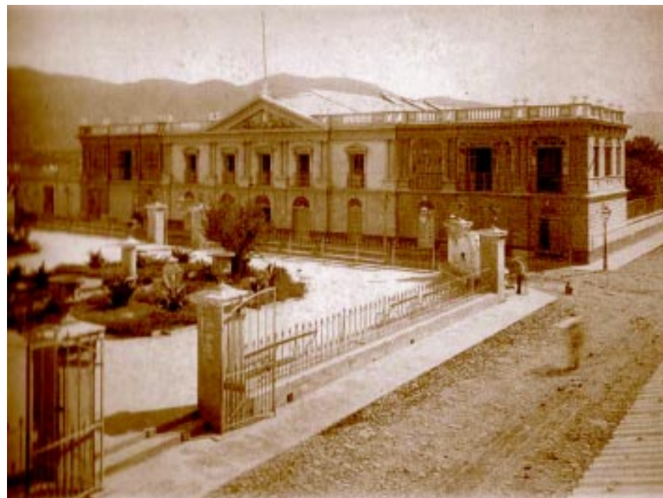
El Teatro Nacional de mediados del siglo XIX, fue arrasado por un incendio y en ese mismo lugar se erigió el nuevo Teatro, que actualmente está en reparación por los daños de los terremotos de 2001.

Ambrogi es escéptico que una gestión progresista pueda tener futuro en una tierra que poco falta por calificarla de bárbara. Los hechos de 1913, confirmarían probablemente, el duro pragmatismo político de la coyuntura histórica en que Araujo se encontraba. Sin embargo, la actitud de Ambrogi, en el plano social no es la de un luchador, un visionario, o cosa que se le parezca, para Ambrogi, la realidad humana, por lo menos, en estos ámbitos, es ingrata; por ello, su mayor concentración vital está en la apuesta hacia la imperecedera palabra. Y ahí encontrará, el autor, su definitiva realización. Ambrogi no será un modernista con pasiones nacionalistas por el bien común, al estilo de Martí, y de tantos otros escritores de la época. Para Ambrogi poco se puede hacer en un medio como el propio; pero como ya afirmábamos donde si se entrega el escritor es en la pasión por la letra plena de sensaciones. Esa será su incuestionable ruta y acierto.