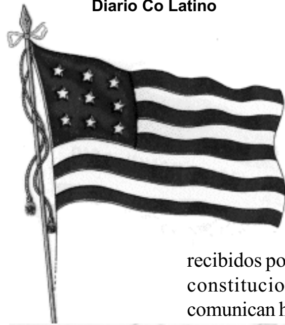
Bandera de la Federación Centroamericana adoptada en 1823

Palacio Nacional de Guatemala, quince de septiembre de mil ochocientos veintiuno.