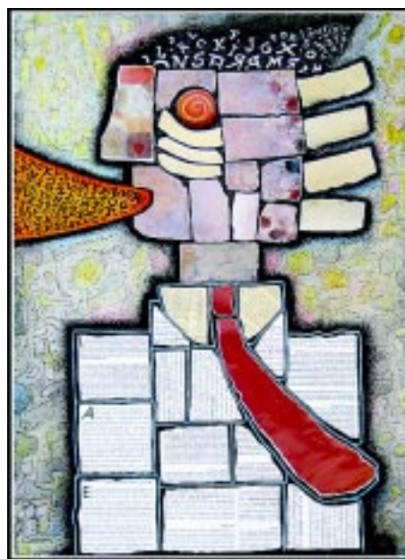
El Intelectual. Tinta, acrílico, grafito, collage sobre papel Canson. Alfredo Sosabravo.

Decía que para los conceptos de cultura, literatura e intelectual resulta más apropiado, y de hecho es así, el uso de la acepción particular, porque eso es lo que se ha acuñado para distinguir rasgos y actividades que la conciencia colectiva define apropiándose de los conceptos. Así, cuando oímos que se rea-