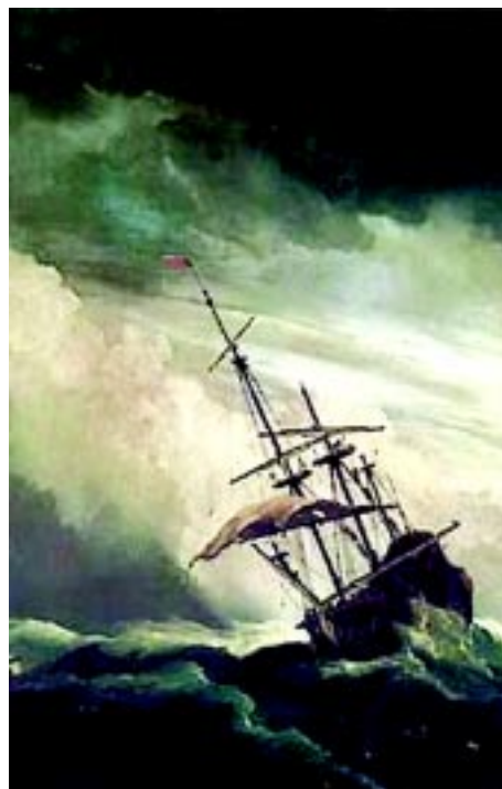
Galeón holandés del s. XVII. Brueghel el Viejo

guiendo las huellas de un canguro me iré a contemplar el nacimiento de los animales más extraños. A través de un murciélago cruzaré por las cuevas en una noche de mil años. En la última nave enviada al Sol me iré rumbo a los rincones más lejanos de este vasto universo, divisaré la Tierra como un grano de arena, más allá de los astros que jamás percibimos. En las alas de las mariposas de San Juan arribaré a la Sabiduría, por las rutas trazadas por Platón y Aristóteles. Caminaré los versos de una oda de Horacio, conoceré a todos los que han hallado el laurel y la muerte. Tomado de la mano de las servidoras de misterios buscaré las cenizas amadas que custodia el barón del cementerio. Tomaré la vía conducente al lugar donde Dante, seguido de la silueta de Virgilio, arriba al infierno, al purgatorio y hasta el paraíso, donde la bella Beatriz Portinari le acompañará. Sacudiré códices en la biblioteca de Alejandría. Descenderé por la senda de los faraones a contemplar la batalla entre Horus y Set y podré presenciar entre las hierbas el origen de los cereales. Me trasladaré con arco y flecha a cazar venados en montes neblinosos. Tomaré el asiento en el que Rosa Parks entró en la eternidad. Tocaré los barrotes en los que Nelson Mandela logró la libertad de todo un pueblo. Escucharé el silbido de la onza de plomo que atravesó la