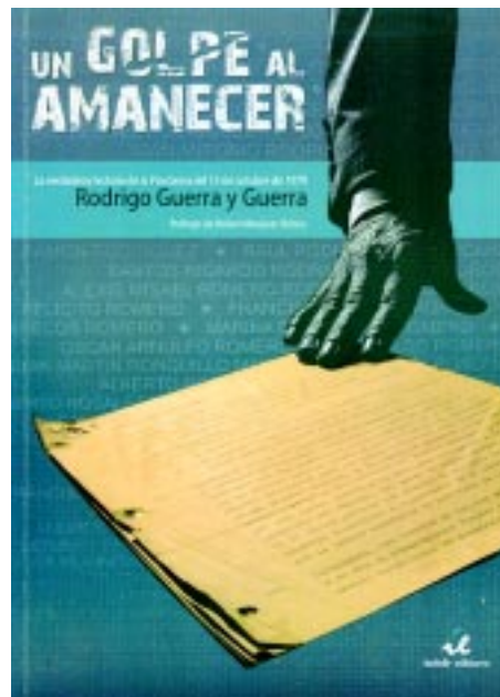
Portada del libro «Un golpe al amanecer» del escritor Rodrigo Guerra y Guerra.

Regresamos tres meses después de un golpe de Estado similar al de 1979, jóvenes militares y civiles. Tres meses después, ante