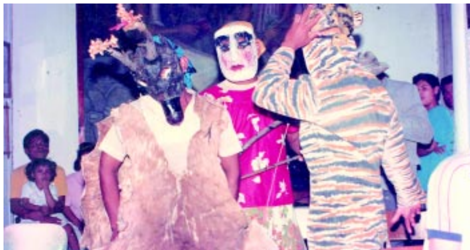
La danza del Tigre y El Venado en la Casa de la Cultura de Zacatecoluca.

Esta tradición que ha divertido a sinnúmero de generaciones, tiene su origen, probablemente en los años posteriores a la colonia española. Una narración de un autor anónimo, recoge la historia, que a continuación se presenta de manera íntegra y sin modificaciones: «...Ya hace mucho tiempo, cuando San Juan Nonualco era un puñado de ranchitos de paja dispersos por los cuatro puntos cardinales, cuando aún no había postes donde ponerlos; cuando todavía no se anunciaba la hora del engendro. Dentro de ese puñado de ranchitos se encontraba Don Pedro de la O, hombre famoso en el lugar por ser buen cazador, ya que donde ponía el ojo, ponía la bala. Aquel día amanecido era espléndido. Precisamente era un día de abril, último mes del verano en aquellos tiempos, e invitaba a Don Pedro a una incursión por aquellas selvas. Se alistó con su escopeta y demás enseres para salir de caza. Al filo del mediodía, con su equipo de perros, se internó en aquella montaña de Dios. Se dirigió a lugares buenos para cazar. La suerte le proporcionó en uno de los recodos a un hermoso